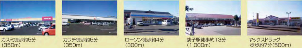
カスミ徒歩約5分(350m) カワチ徒歩約5分(350m) ローソン徒歩約4分(300m) 銚子駅徒歩約13分(1,000m) ヤッコスドラッグ徒歩約7分(500m)